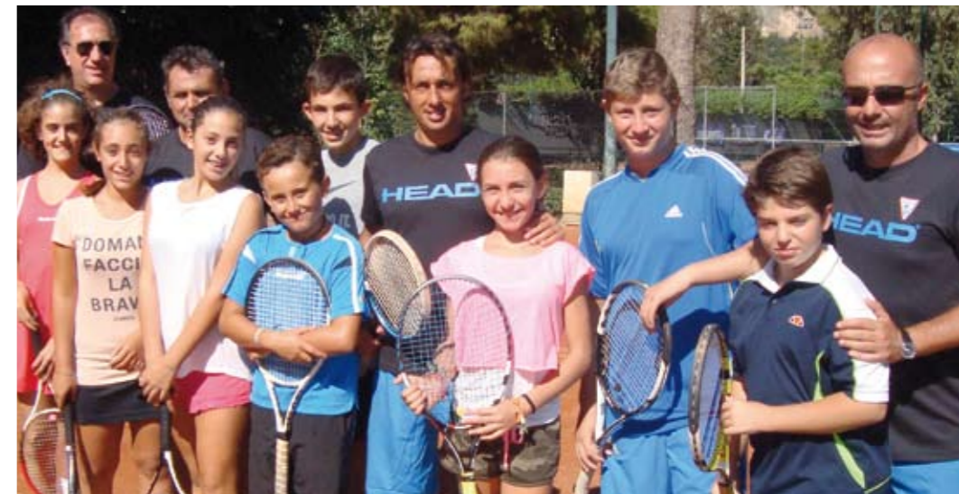
Un gruppo di giovani in prova per la Scuola tennis con alcuni dei maestri

Il Circolo tiene molto alla Scuola Tennis e al minitennis per i più piccoli, tanto che nell'area del muro grazie allo sponsor della serie A1 “Tecnica Sport” è in allestimento una zona tutta dedicata ai piccoli allievi con due minicampi da undici metri per cinque e una parte dedi-