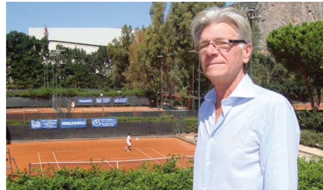
Il presidente del Circolo Ciccetto Tesaurò fa il punto della situazione a quattro mesi dalla sua elezione

È necessario che non solo la deputazione, ma l'intero tessuto sociale del Circolo, abbiano la consapevolezza dell'entità dell'azione di risanamento che dovrà essere apportata con l'inevitabile corredo di tagli e ridimensionamento di costi