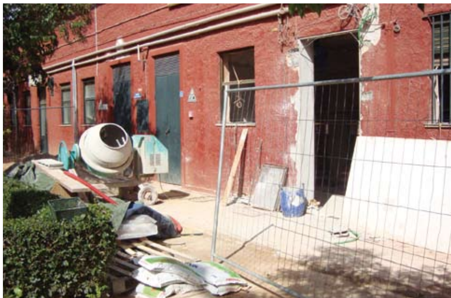
Un'immagine scattata lo scorso marzo durante i lavori di ristrutturazione sotto le tribune

“Abbiamo anche spostato la centrale termica che si trovava sotto il vecchio spogliatoio maschile - spiega Alfonso