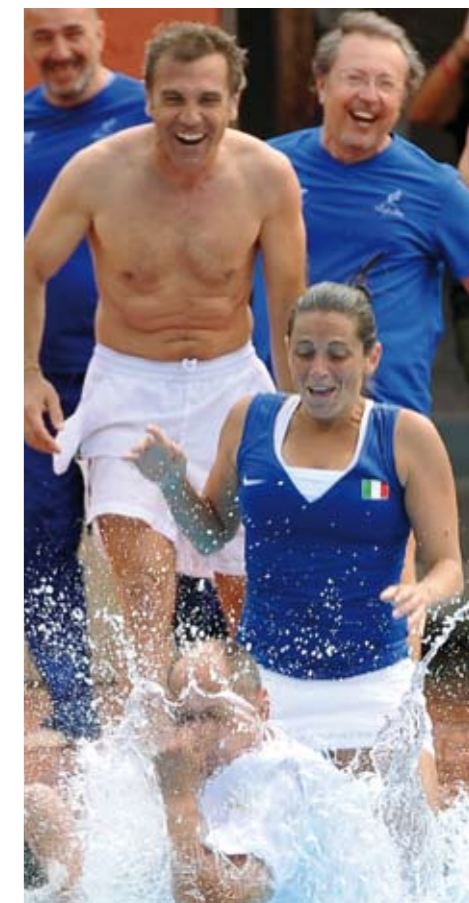
In questa e nella pagina a fianco, alcune immagini della bella vittoria in Fed Cup